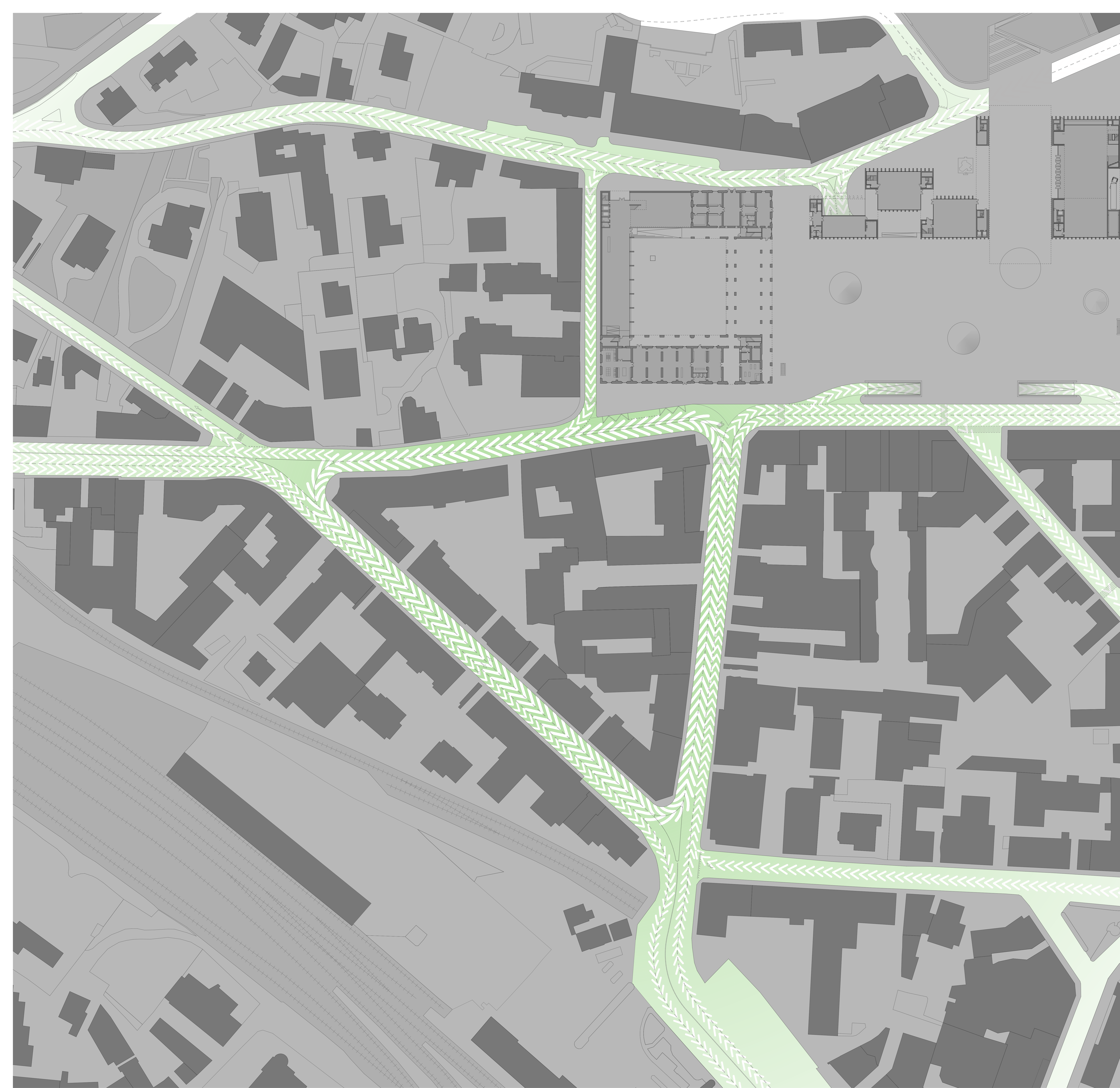
PIANO MOBILITÀ 1: 500